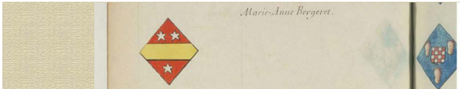
BERGERET, : Registre 29 - Provence 1 page 671